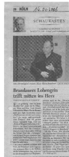
Zeitungsbericht vom 16.01.2008 über die Verleihung der Ehrenmitgliedschaft an Klaus Maria Brandauer