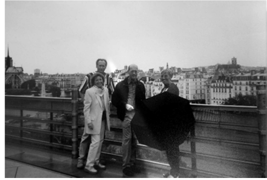
Juli 2000 - Mitglieder des RWV Köln in Paris