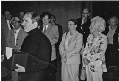
5. Juli 2002 – Verabschiedung von James Conlon.

Abschied von dem Generalmusikdirektor des Gürzenich-Orchesters James Conlon durch den Kölner Wagnerverband nach der Generalprobe seines letzten Konzerts in der Philharmonie