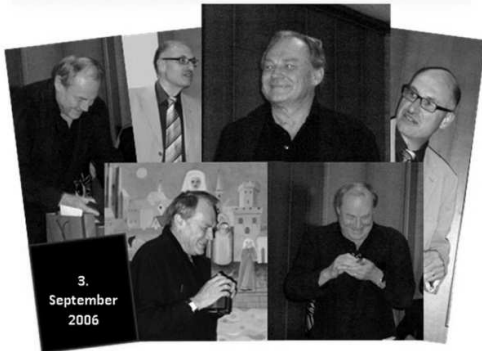
Klaus-Maria Brandauer 2006 und 2008 zu Gast beim RWV Köln Fotos: K. Ebert und H.-U. Häfner, Kollage: M. Voß